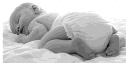
младенец вне общества гарантированно погибает

Человек — существо 100% социальное (общественное):