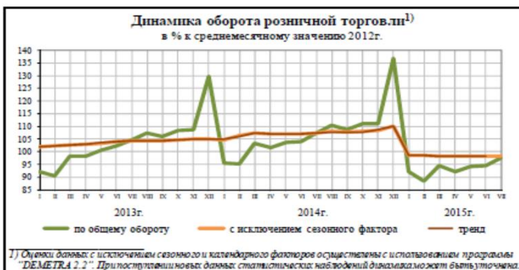
Рис. 1. Оборот розничной торговли [1]

По оценке Минэкономразвития России, прирост составил 0,1% к предыдущему месяцу.