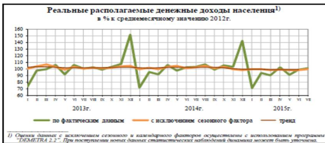
Рис. 4 Реальные располагаемые денежные доходы населения [1]

По данным исследовательского холдинга Ромир в июле 2015 года индекс потребительской активности вырос на 2,2% относительно июньского значения, когда в июне наблюдалось снижение этого показателя на 6,7 %.