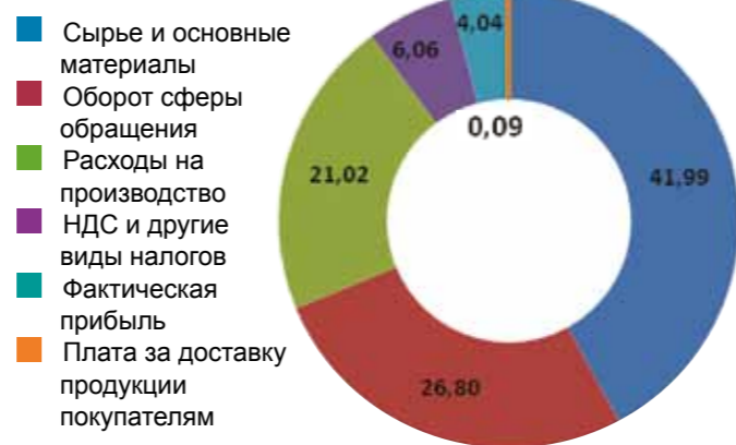
Диаграмма 2. Структура розничной цены на мясо птицы, % к розничной цене

Например, по официальным данным, затраты на сырье в структуре розничной цены на мясо птицы составляют 42%. Больше четверти продукта совокупно формируют торговая надбавка, затраты организаций розничной торговли, стоимость доставки. И 21% приходится на оплату электроэнергии, заработную плату сотрудников и прочие производственные расходы сельскохозяйственных предприятий.