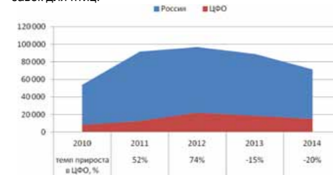
График 2. Динамика производства белково-витаминных добавок для птиц в России и ЦФО в 2010–2014 гг., т

Динамика производства белково-витаминных добавок для птиц в Центральном федеральном округе повторяла изменения, происходившие на территории России в целом. Так, в 2010–2012 гг. выпуск добавок вырос до 22 тыс. тонн. В 2013–2014 гг. после слияния игрока рынка — компании «Провими» с американской Cargill и резкого сокращения выпуска белково-витаминных добавок, в субъекте была зафиксирована отрицательная динамика, и в 2014 г. предприятиями округа было предложено рынку 15 тыс. тонн добавок для птиц.